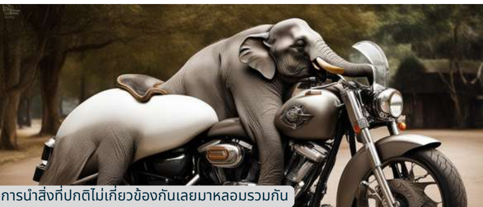
ความคิดเชื่อมโยง คือการนำสิ่งที่ปกติไม่เกี่ยวข้องกันเลยมาหลอมรวมกัน